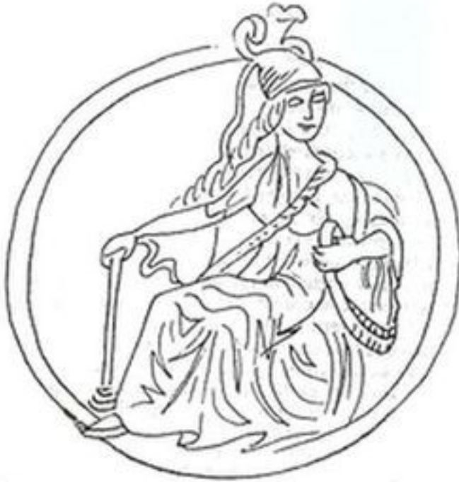
Représentation de Rome comme une femme riche ou une déesse assise (cf. Ap 17.1ss). Plat romain du 1 er siècle apr. J.-C.